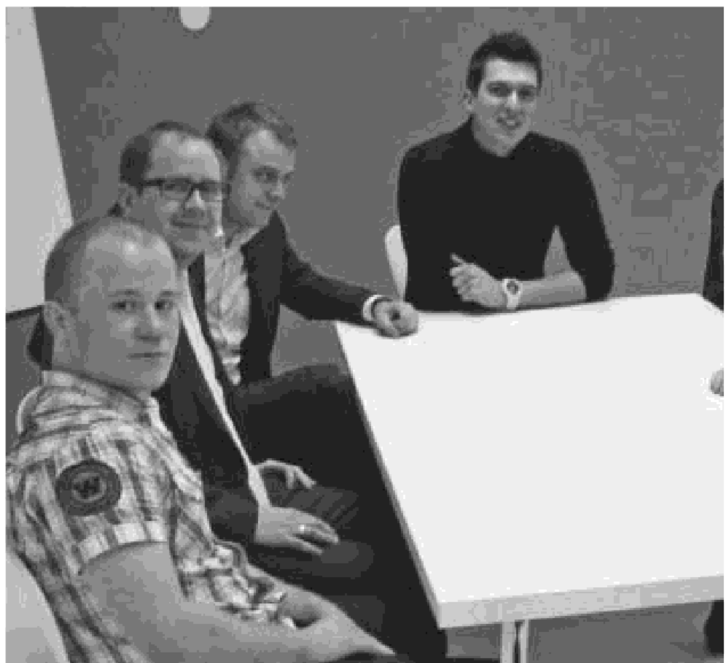
StartUp AIP Częstochowa wraz z założycielem Fundacji Akademickich Inkubatorów Przedsiębior

„Pomysł na własną firmę pojawił się już dawno, ale na początku wydawał się dosyć abstrakcyjny. No bo jak? Bez pie-