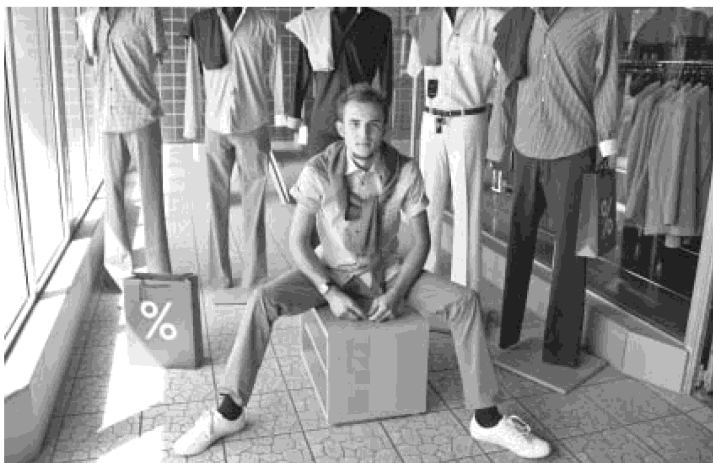
Także on najlepiej czuł się w ubraniach na luzie