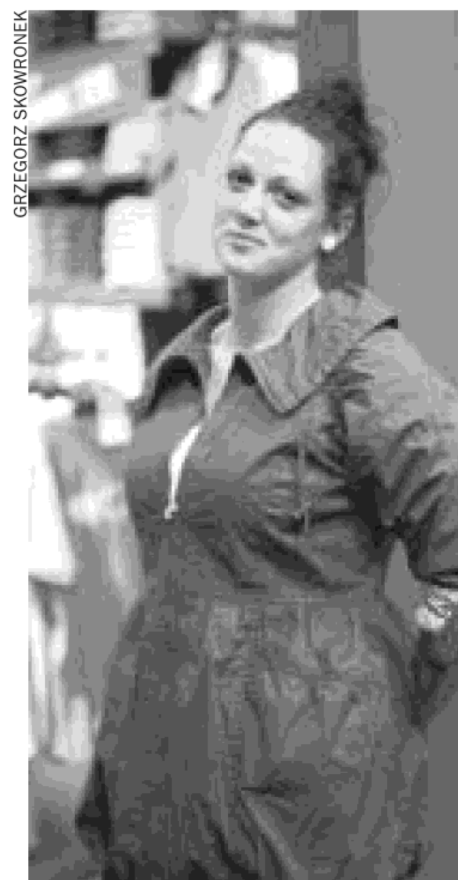
Taki płaszcz studentka wybrała dla siebie